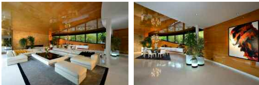
Ci-dessous : tapis (Limited Edition & Kyle Bunting). Mobilier (Ets Cormier). Tableau de Jean Soyier. Table de salle à manger (Caroline Corbeau). En bas à droite : bureau sculpture sur bois de l'artiste Alain Legros. Chaise (Desalto).