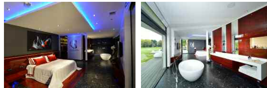
Ci-dessous : tableaux de Pascal Guérineau. Baignoire (Teuco). Sanitaires et accessoires (Gessi).

table en verre aux bords brisés et bruts et dont les pieds en acier brossé forme une écriture sinieuse et expressive. La cuisine entière ronde, signature de Jean-Luc Cormier, apporte avec élégance une touche de convivialité. Le repose pieds du bar en granit permet une position confortable tout au long de l'apéritif ou du repas. Elle est équipée du dernier cri technologique en matière d'appareils ménagers. L'évier quand à lui est caché dans un bloc entièrement réalisé en Corian. Le bar se lève électriquement grâce à des vérins et les crédences en bois de cerisier sauvage montent d'un simple clic pour laisser place à un rangement insoupçonné pour les robots et autres petits appareils ménagers. La suite parentale de 70 m 2 est un bijou de raffinement et de confort. Le dressing en acajou a une structure entièrement réalisée en érable massif. Les tiroirs sont quant à eux gainés de cuir de veau ce qui signe